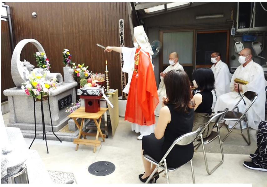
愛子廟開眼式 住職による開眼修法

日々お題目を信唱し世界平和と疫病禍の早期収束、医療従事者の安全と罹患殉難者の追福菩提をお祈りし、併せて檀信徒・有縁の皆様のご安泰をご祈念致します 南無妙法蓮華經