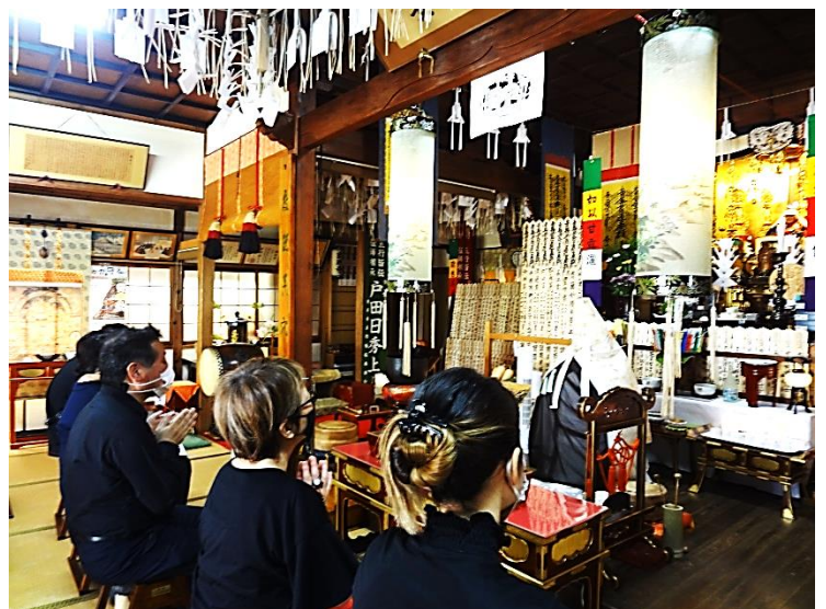
初盆特別供養の法要

全ての生命体はみ仏の生命を輝かせる尊き存在であり、愛される子供たちであるとの教えから、『愛子廟(あいしびょう)の永代納骨料は、種類、大きさに関わらず、同一の参萬円の御志納といたします。』